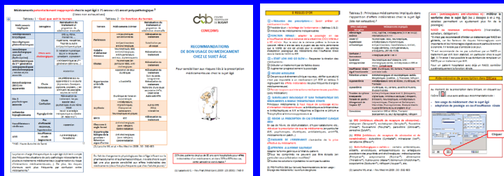
Triptyque de bon usage du médicament chez le sujet âgé

Résultats & discussion : Le développement de ces aide-mémoires a amélioré l'accès aux informations dans DxCare® en diminuant le nombre de clics. Cependant, les interfaces déjà proposées par les logiciels pose des contraintes techniques. En effet, ils n'autorisent pas l'émission des alertes sur deux critères duals (e.g. la prescription d'un médicament inapproprié et l'âge \geq 75 ans, bien que nos centres accueillent des patients de tout âge). L'utilisation de ces aide-mémoires n'est donc pas pour l'instant optimale (alertes non automatiques), d'où l'importance de la campagne d'information faite grâce au triptyque qui décrit l'accès manuel à cet outil dans le DPI.